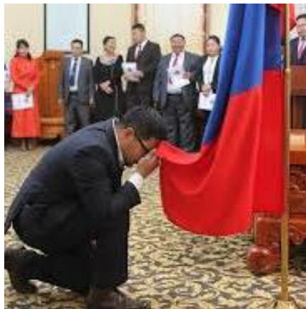
Төрийн захиргааны албан хаагч