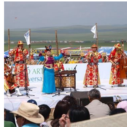
Төрийн үйлчилгээний албан хаагч