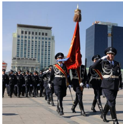
Төрийн тусгай албан хаагч