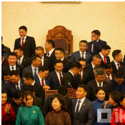
Улс төрийн албан хаагч