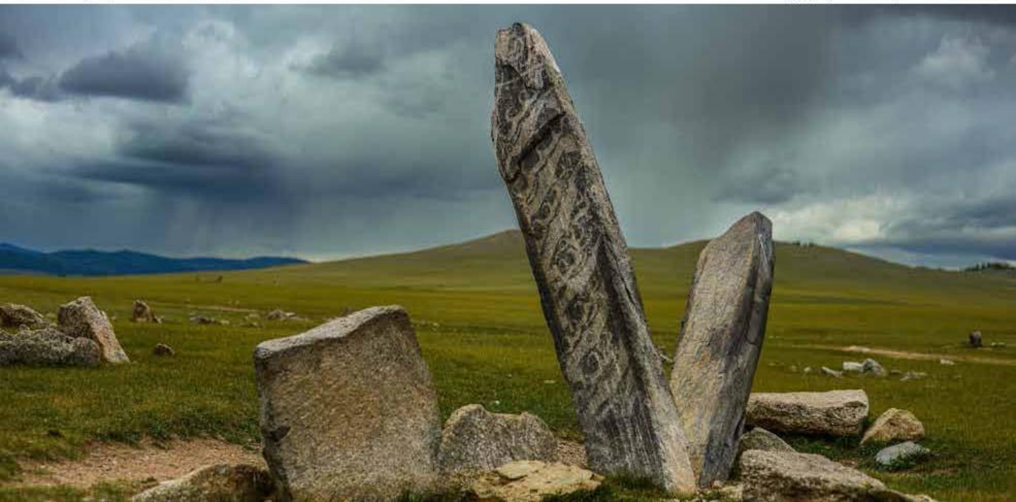
Дунд Жаргалантын буган хөшөө