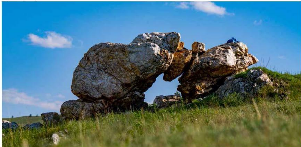
Цагаан чулуут, Сэнжит хад