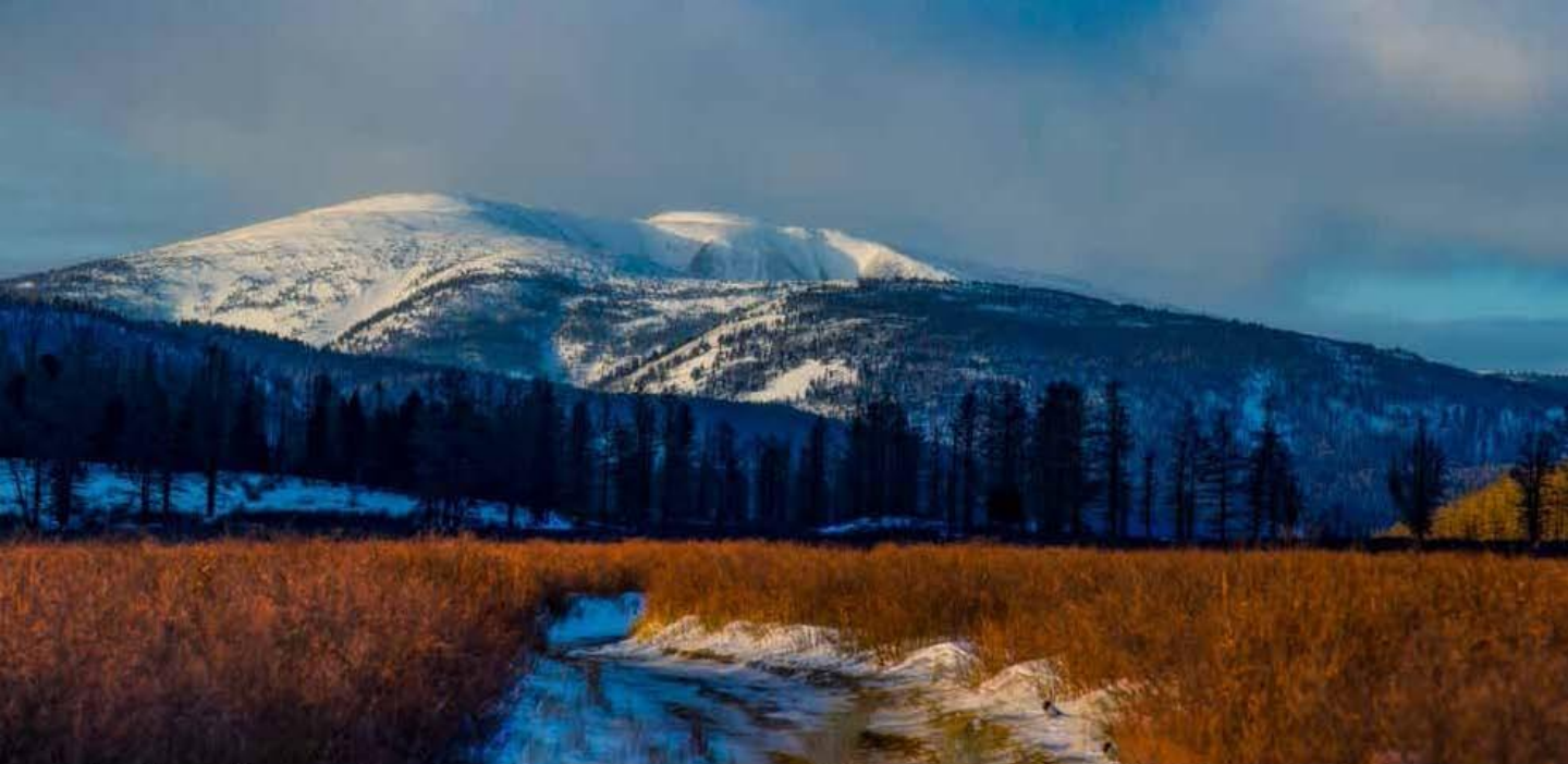
Бурхан Халдун хайрхан