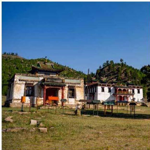
Балдан Брай бун хийд