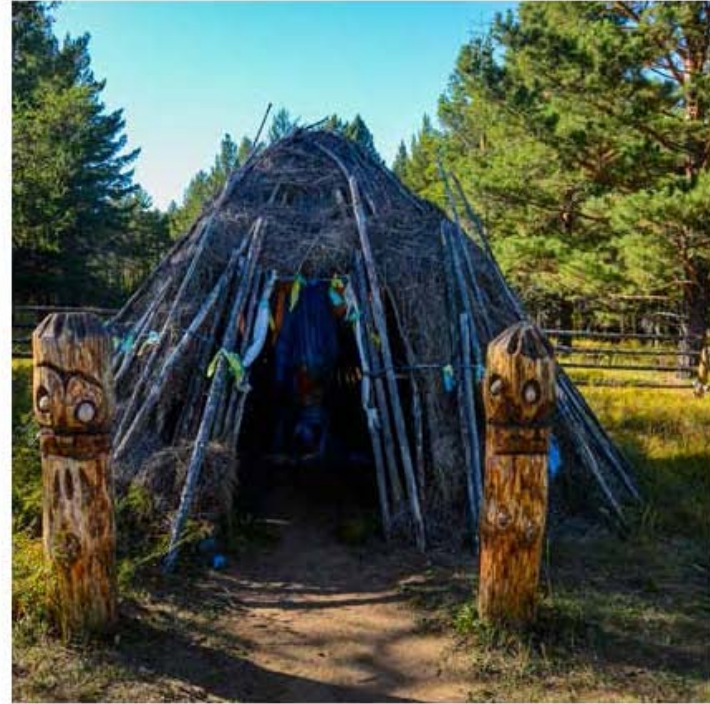
Боданчирын өвсөн эмбүүл