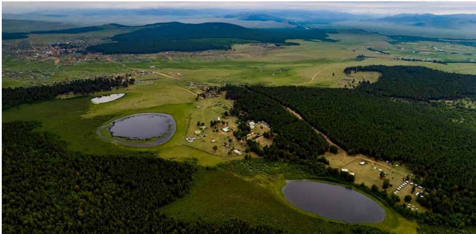
Хар тугийн овоо, Гурван нуур