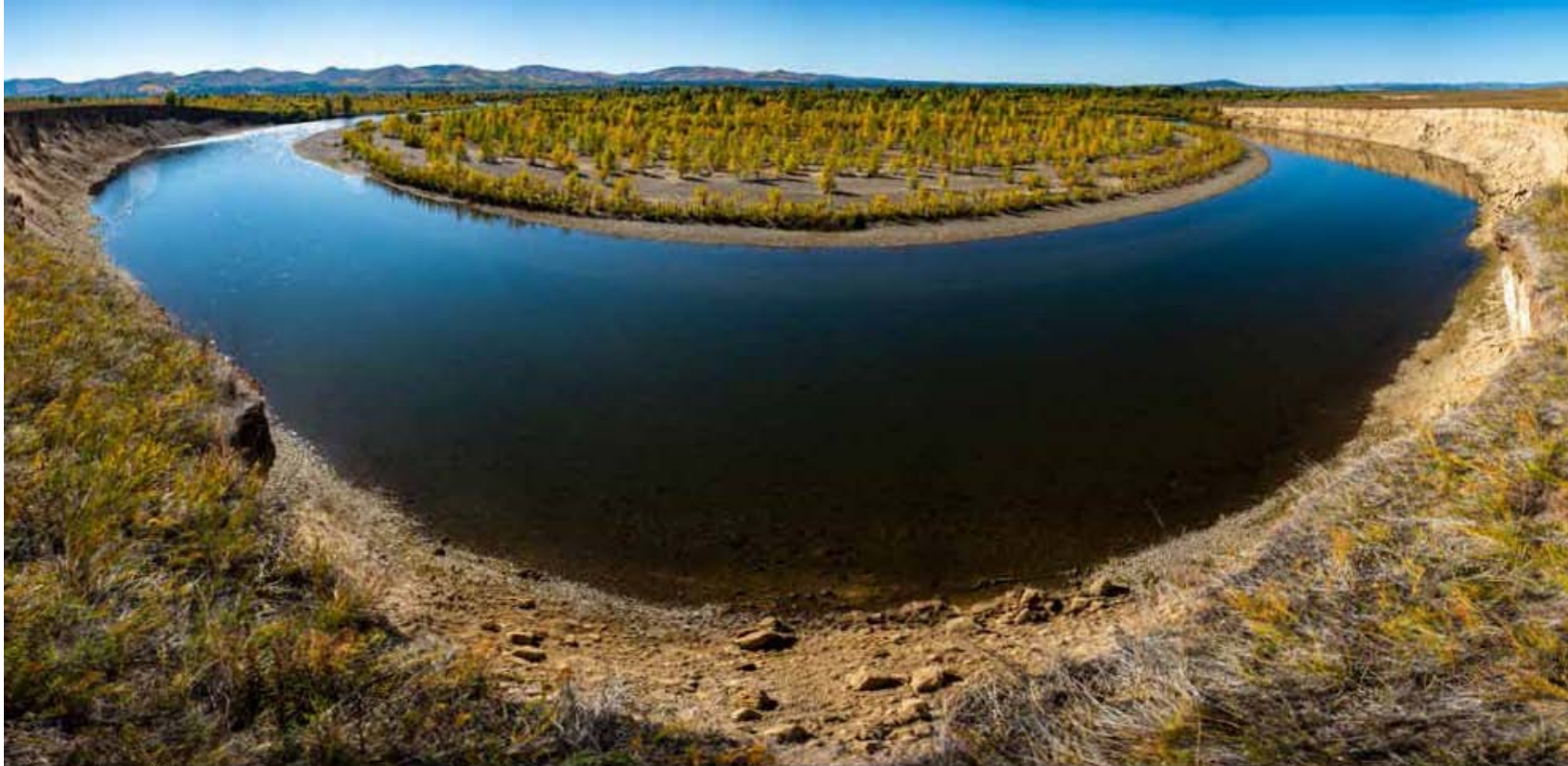
Балжийн цагаан эрэг