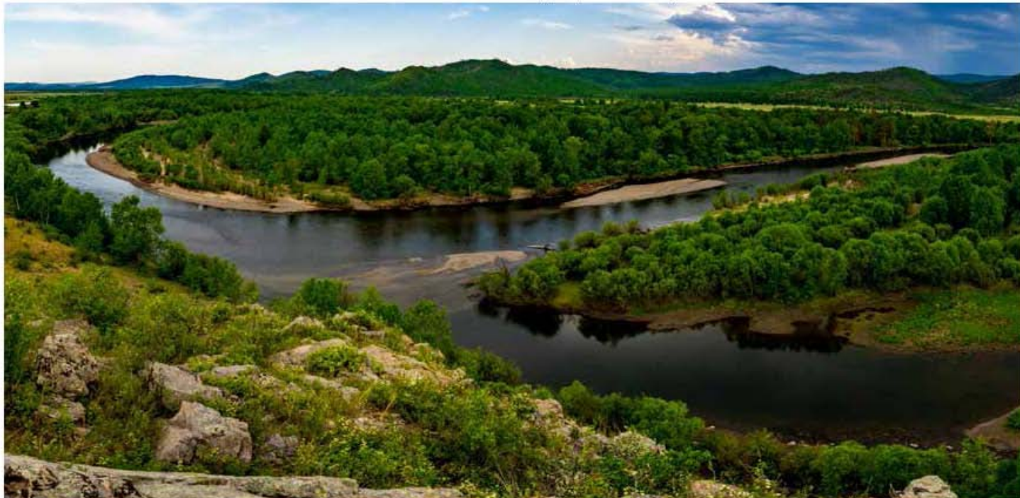
Балж голын хөндий