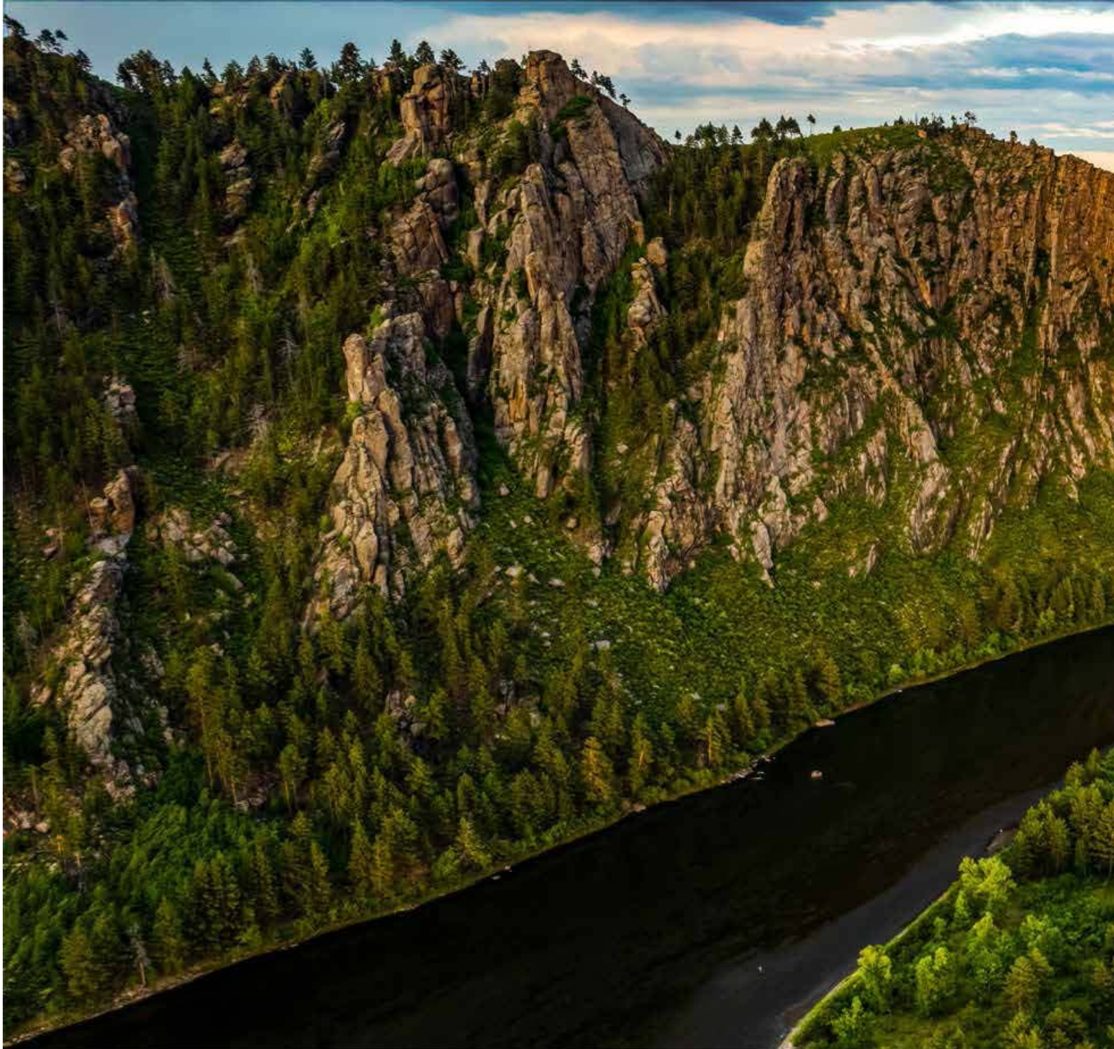
Дэгнэ Жигнэ/Эзэрэн хавцал