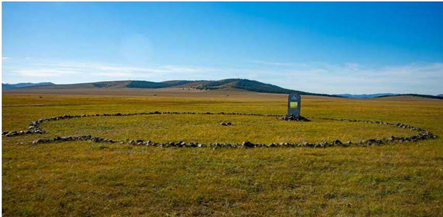
Богд хааны сүүлчийн хатан Наваанлуvsангийн Гэнэнпил хатныгэрийн буурь