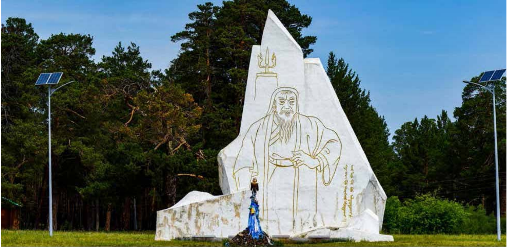
Чингис хааны гэрэлт хөшөө