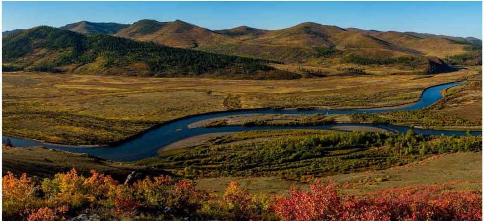
Онон, Балжийн бэлчир