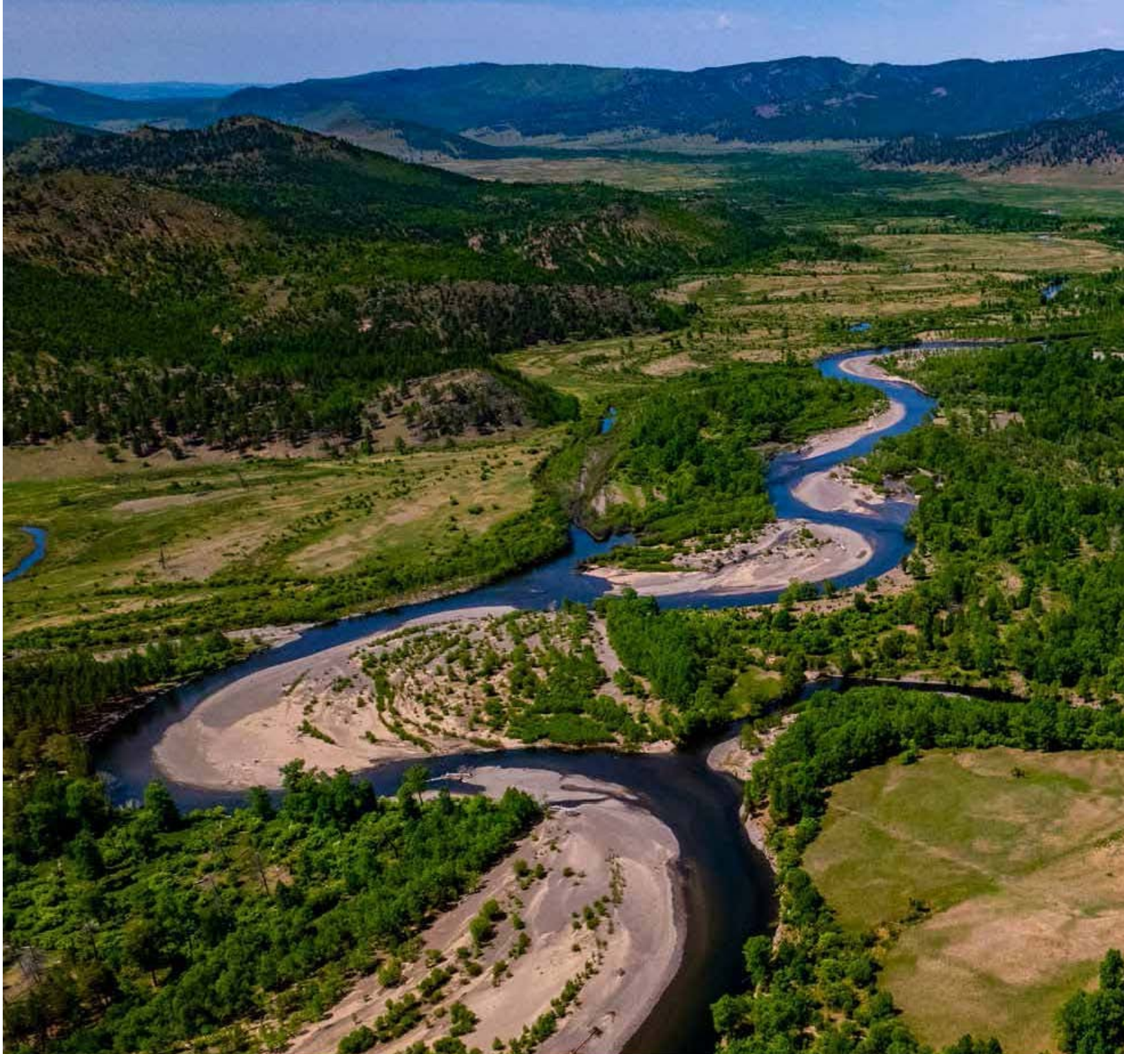
Баянх аан уул, Хёрхон, Балжгол уудын бэлчир