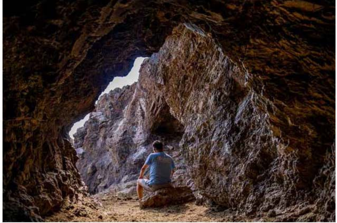
Есөн хүний агуй