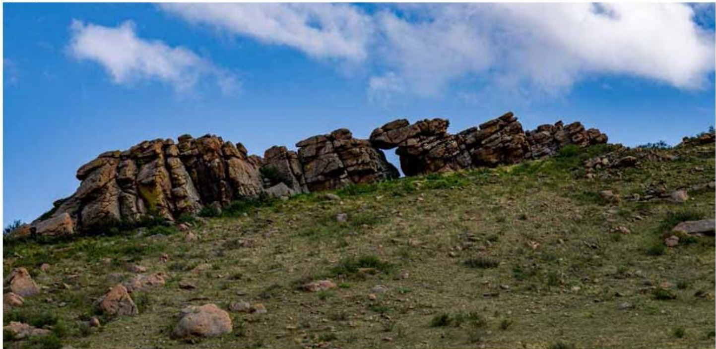
Салхитын Сэнжит хад