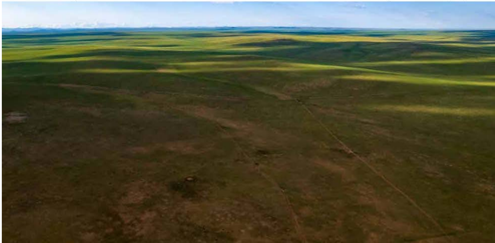
"Тосон хулстай" Байгалийн нөөц газар