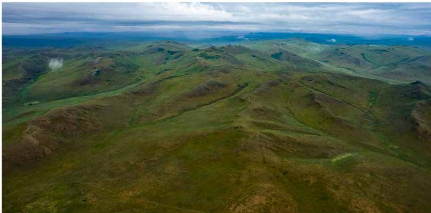
Хар ямаатын байгалийн нөөц газар