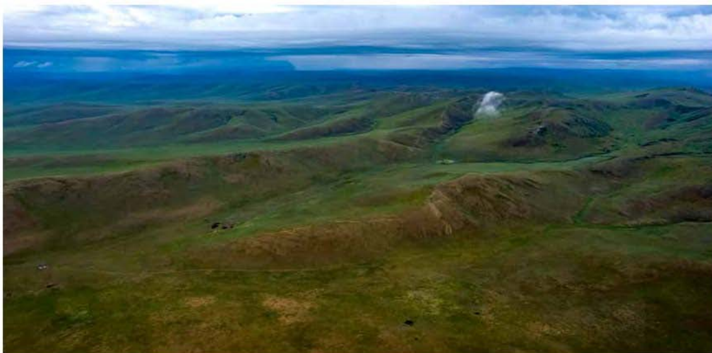
Хар ямаатын байгалийн нөөц газар