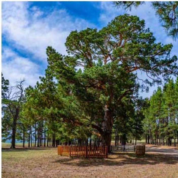
Хамгийн бүдүүн нарс