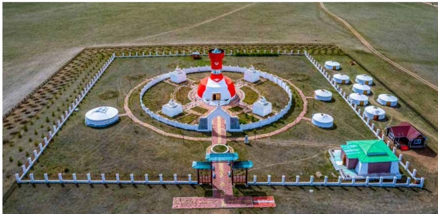
Монгол Хатдын Хүндэтгэлийн өргөө цогцолбор