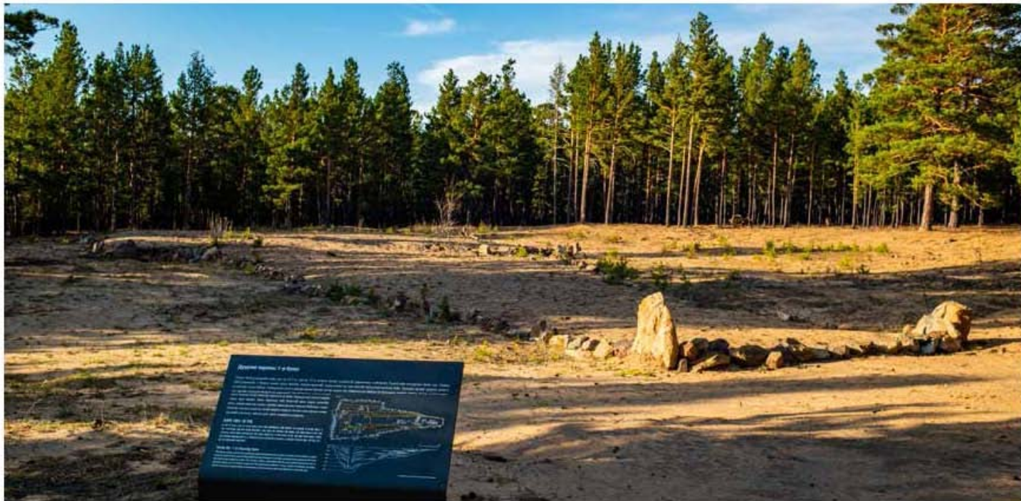
Дуурлиг н а р с, Дуурлиг н а рсны Хүн нүгийн булш