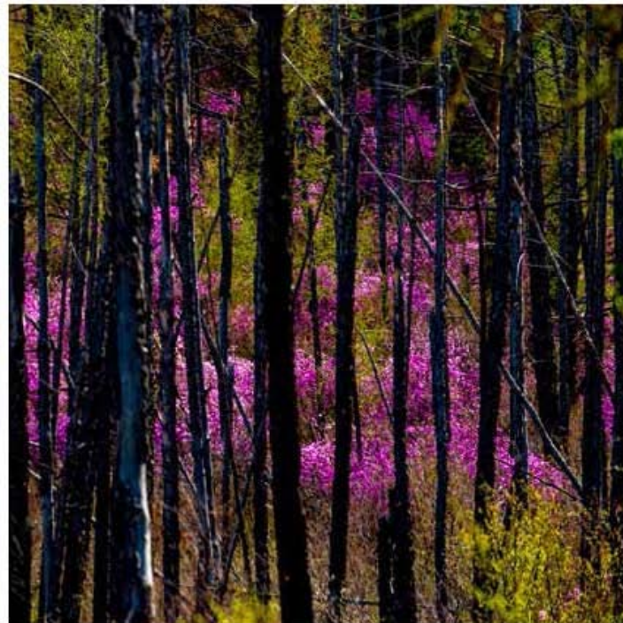
Далийн ягаан цэцэг