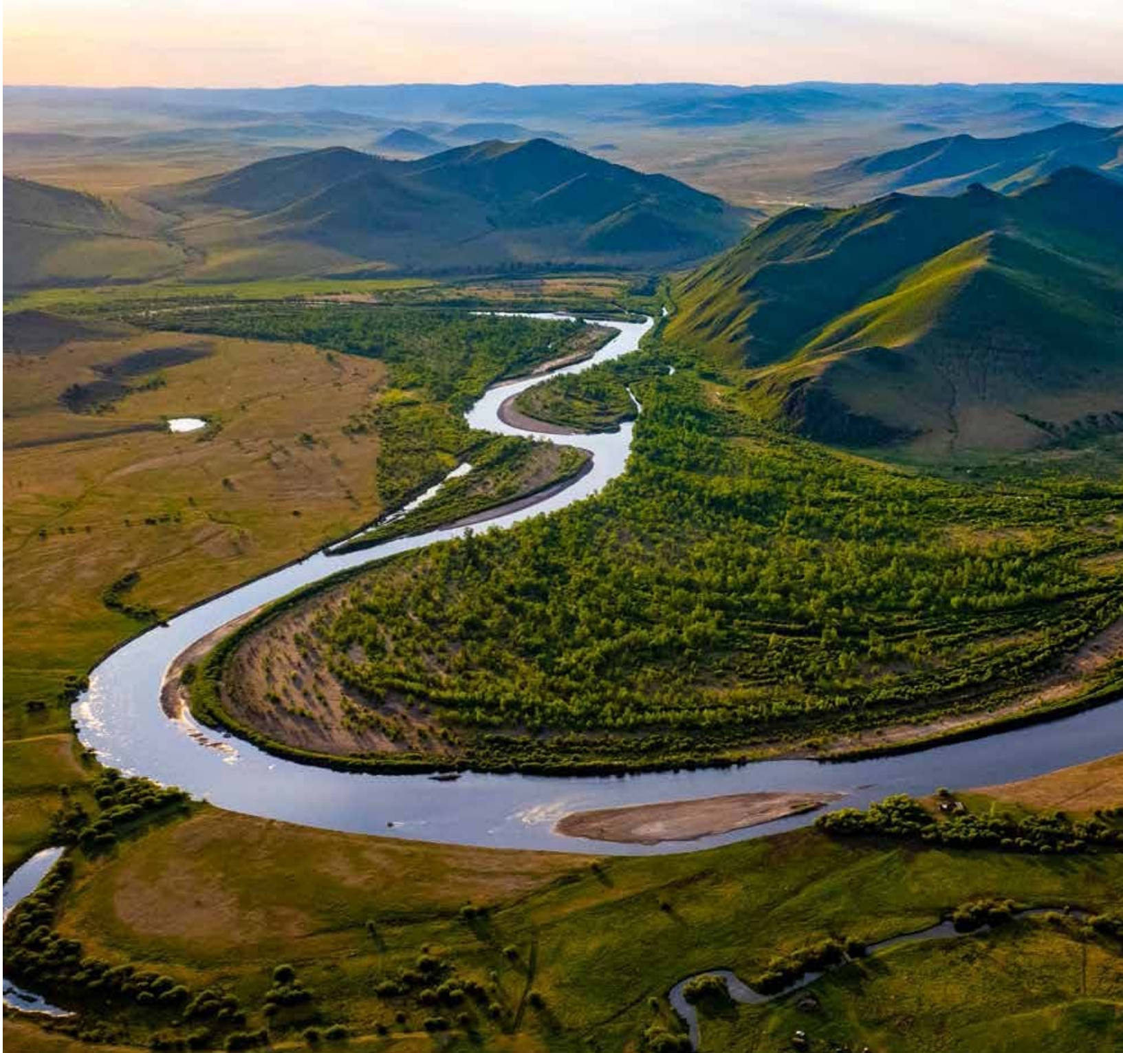
Онон, Шуусын бэлчир