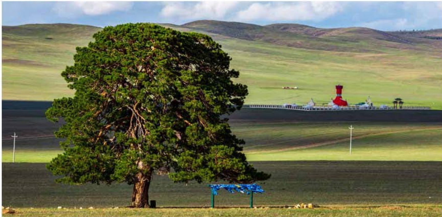
Хүслийн мод, Монгол хадын өргөө